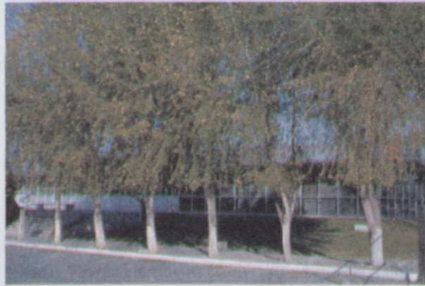
Figura 2. Populus canadensis , comúnmente cultivado en las banquetas de la ciudad.

Nativo de Europa. En la ciudad de Aguascalientes es ampliamente utilizado como árbol de ornato, en calles, parques y jardines. Se considera que es un híbrido entre Populus deltoides y Populus nigra ya que presenta características de ambas especies (Bailey 1975), parece que ha dado muestras de ser mas vigoroso y fácil de propagar que cualquiera de sus progenitores.