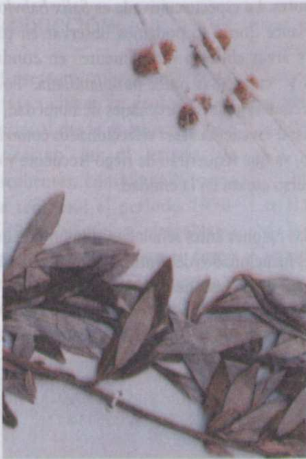
Figura 7. Salix schaffneri , especie poco frecuente encontrada en la barranca La Pinsi6n, municipio de San Jos6 de Gracia.

Su distribuci6n se reporta para San Luis Potos6, Guanajuato, Quer6taro y Veracruz como especie poco frecuente vulnerable a la extinci6n. En el estado de Aguascalientes se localiza en forma de manchones, en algunas barrancas como La Pinsi6n y Piletas, en altitudes que var6an de 2380 a 2500 m a orilla de arroyos asociados a bosque de encino-pino.