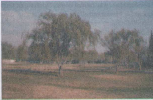
Figura 5. Salix babylonica , conocido como sauce llorón.

Nativo del norte de China, probablemente es una de las especies que introdujeron los españoles, en la época de la colonia.