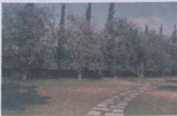
Figura 1. Populus alba «álamo plateado»

Nativo de Europa Occidental y Asia Central. En el estado de Aguascalientes se le encuentra únicamente cultivado en calles, parques y jardines.